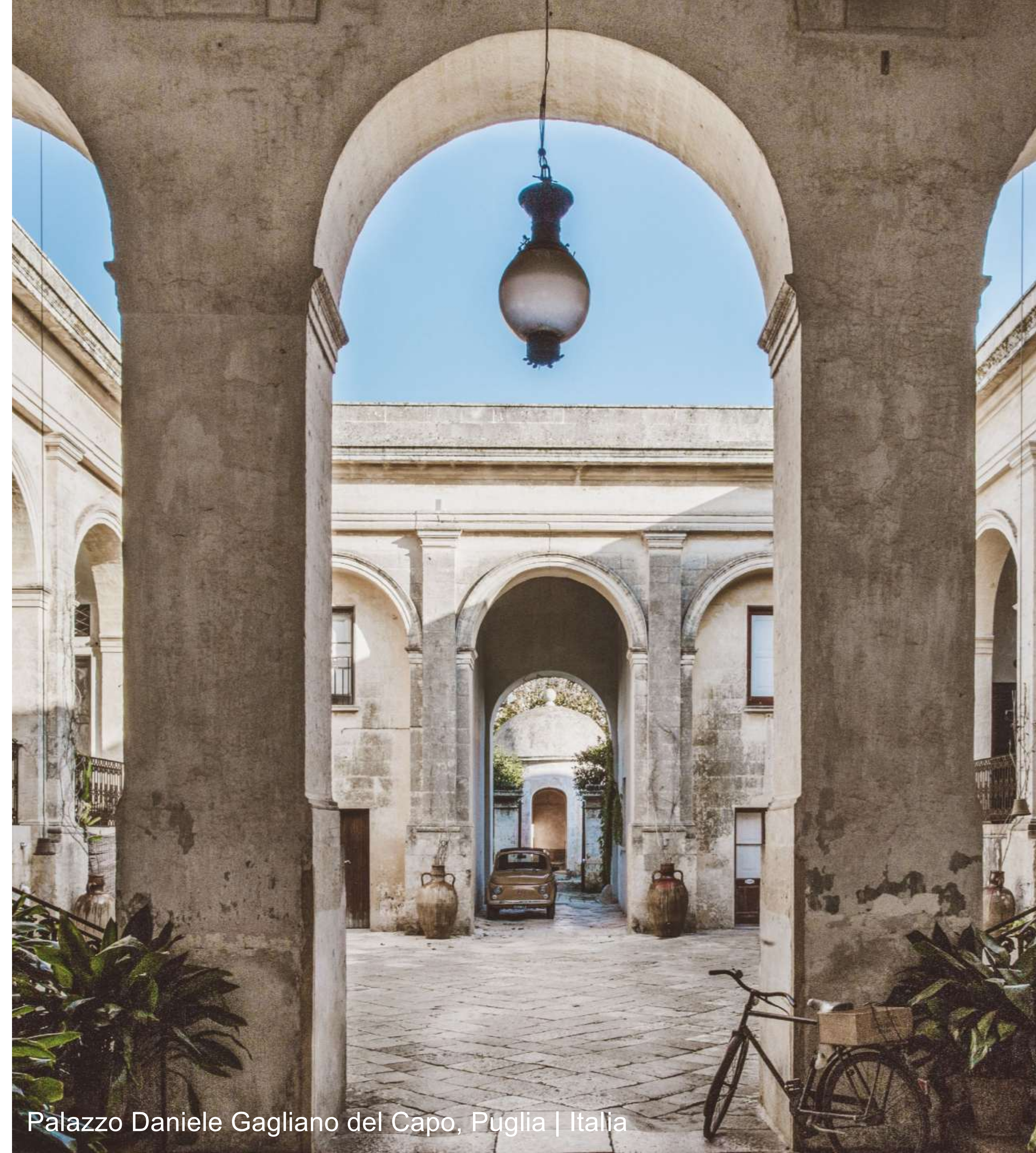
Palazzo Daniele Gagliano del Capo, Puglia | Italia

Más de 100 hoteles miembros forman parte de Collective, ofreciendo experiencias de hospitalidad únicas.