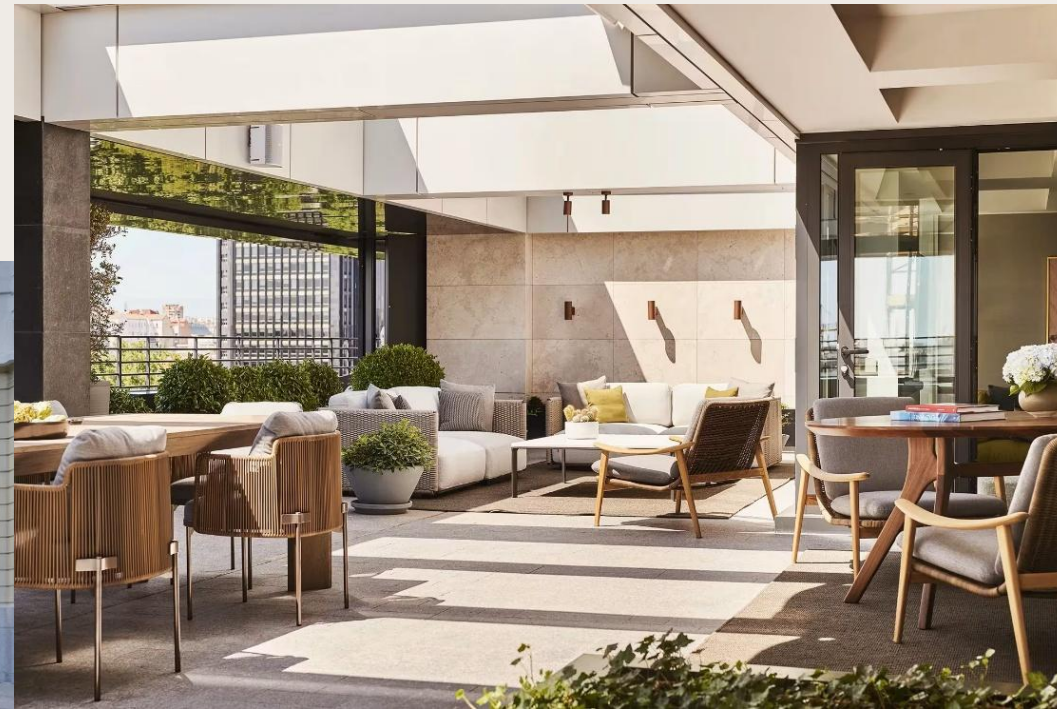
The Rosewood Villa Magna