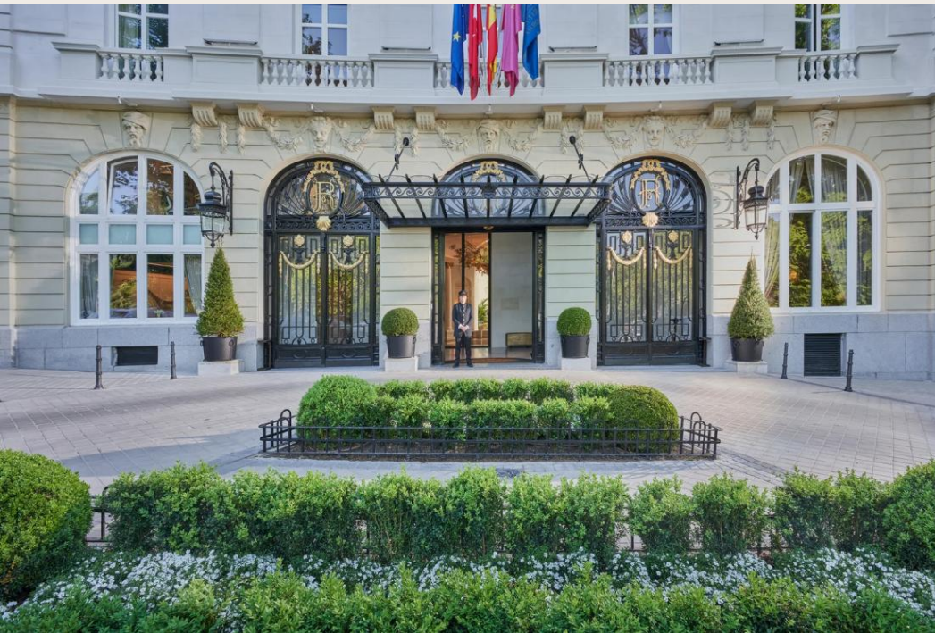
Ritz Mandarin Oriental

Selección de los mejores alojamientos 5*