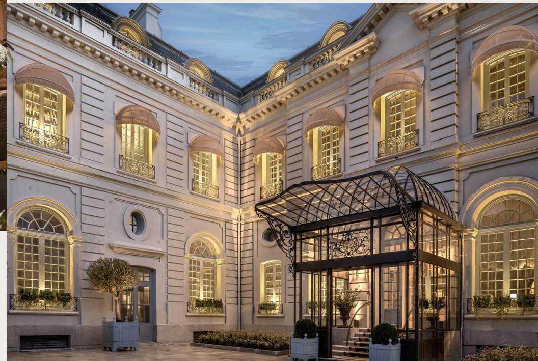
Santo Mauro, a Luxury Collection Hotel