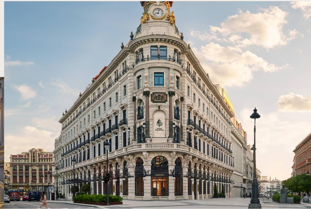
Four Seasons Hotel Madrid