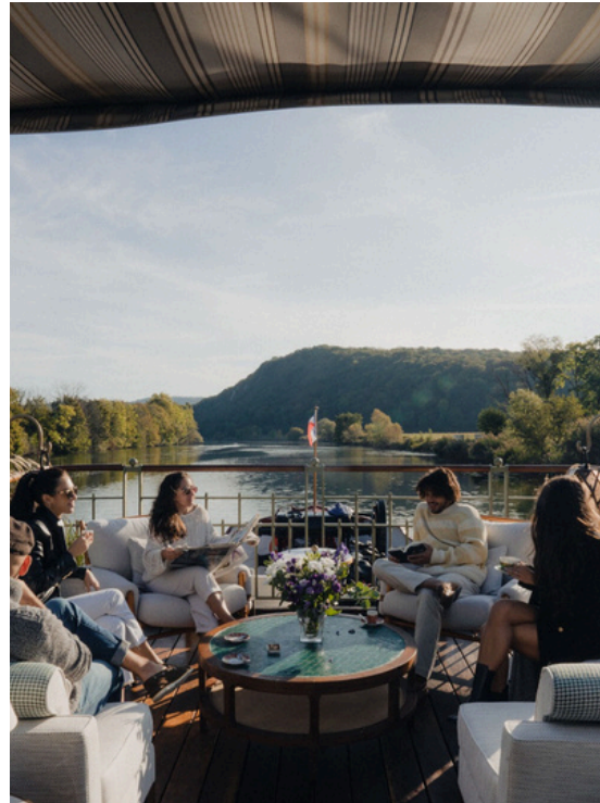
Viajes en familia y experiencias multigeneracionales