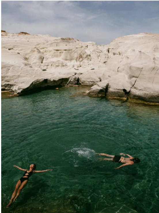
Lunas de miel y escapadas románticas

Cada viaje se diseña y gestiona a partir de un entendimiento profundo del estilo de cada cliente, incluyendo: