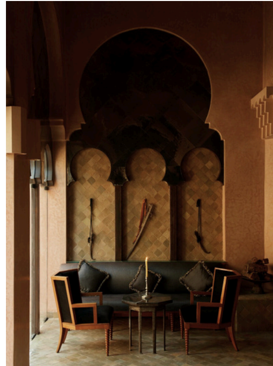
Hoteles de lujo, resorts y villas privadas