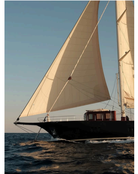
Cruceros, yates y viajes de expedición